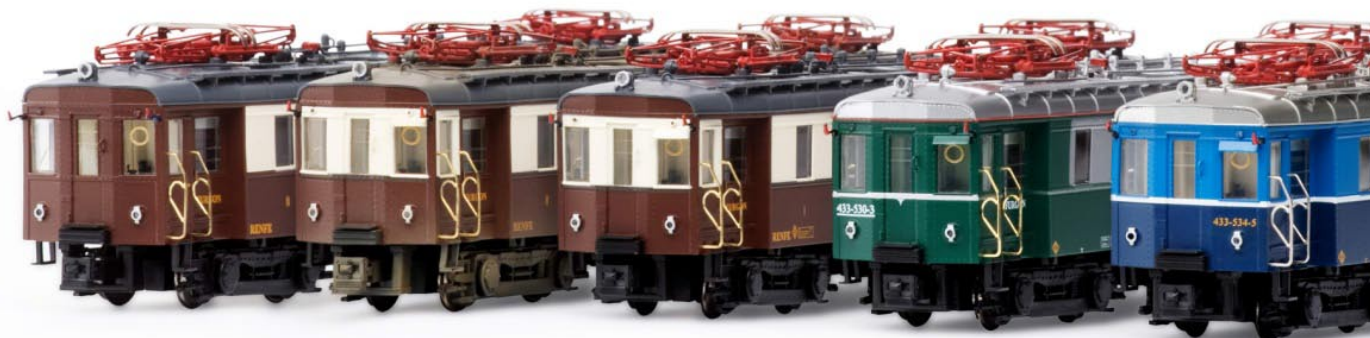
Imagen de las 5 versiones por estricto orden de referencia

- Referencia 46044: Versión años setenta y años ochenta (entre 1970 y 1984 aproximadamente) Época IV. Nuevo cambio de librea, adoptándose los colores unificados en tonos azules del material automotor, que se había empezado a utilizar en los trenes TER. Sin indicación de la clase en ninguno de los dos coches. Numeración UIC solo en el coche motor. Esta fue la última versión de estas unidades.