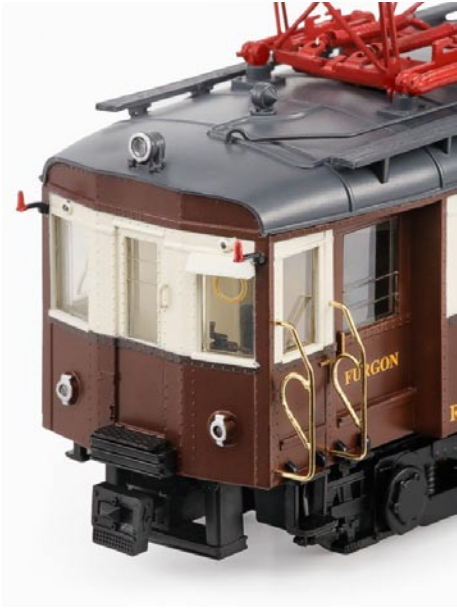
Versión años 60, principios 70 ref 46042