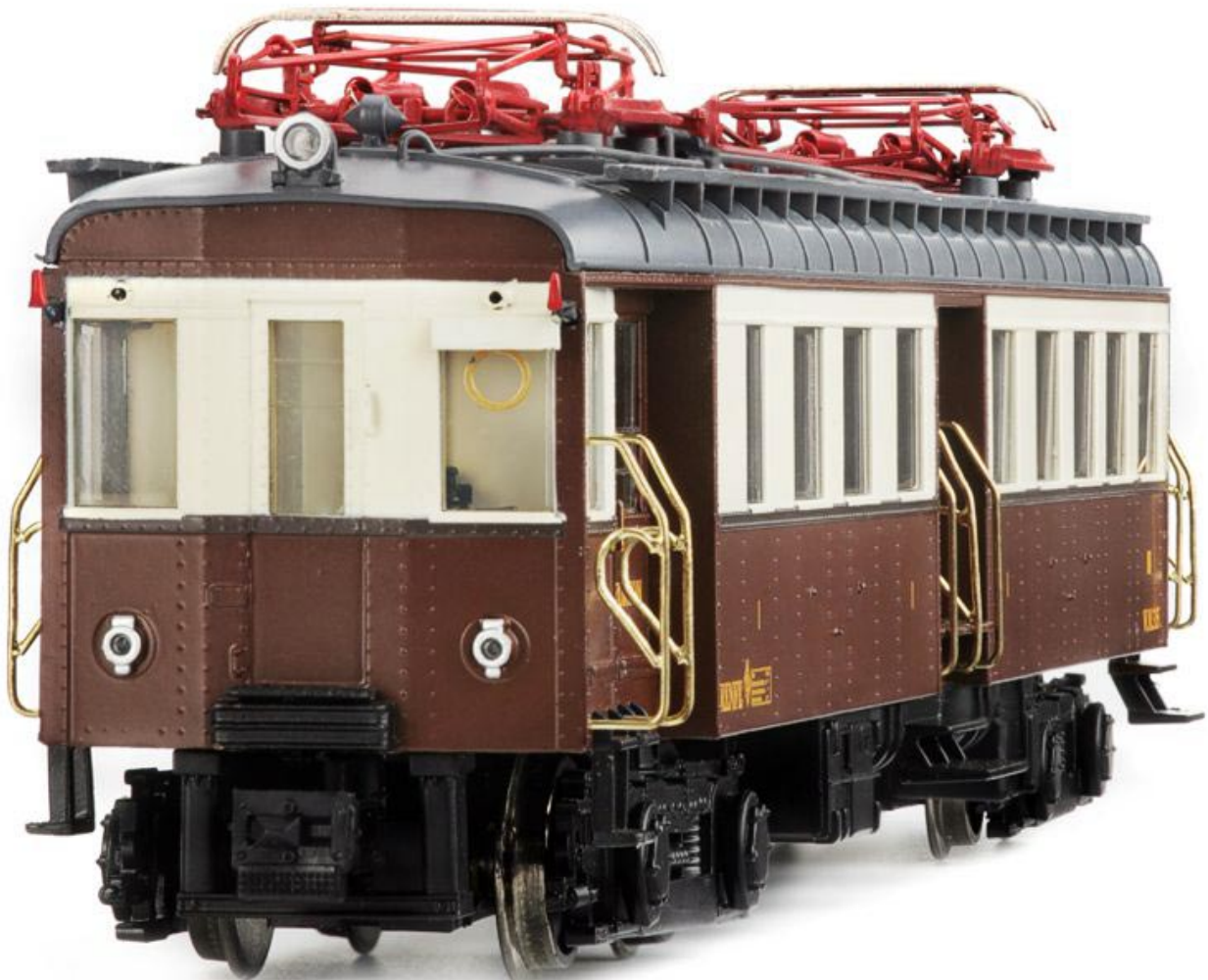
Versión años 60, principios 70 ref 46042