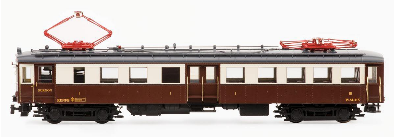
Versión años 60, principios 70 ref 46042