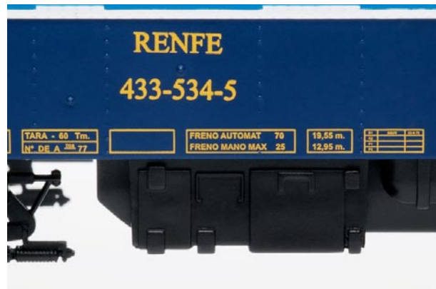
Versión años 70 y 80 ref 46044

Atención: Fotografías de los modelos reproducidos, se trata de modelos de preproducción y por lo tanto pueden estar sujetos a posibles cambios y/o modificaciones.