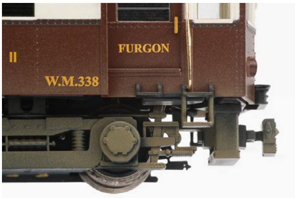
Versión años 50, principios 60 ref 46041