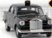
13354 MB 190c „Taxi“ von Starmada 14,90 €