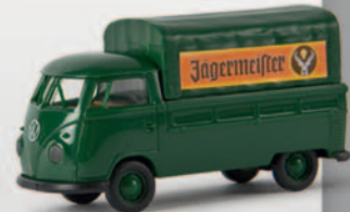
v 32945 VW Pritsche T1b „Jägermeister“ 11,90 €