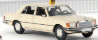
13159 MB 450 SEL „Taxi“ von Starmada 14,90 €