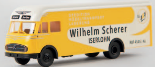
v 57216 MB LP 322 Möbelwagen „Wilhelm Scherer“ 16,90 €