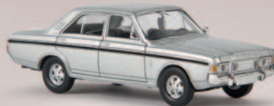
n 19460 Ford RS (P7b), silber, TD 12,90 €

Lange vor Erfindung des „GTI“ schuf Ford bereits die „RS“-Linie, unter der sportlich aufgewertete Versionen mit kräftigen Motoren angeboten wurden. Die beiden Modelle entsprechen Vorbildern aus 1969.