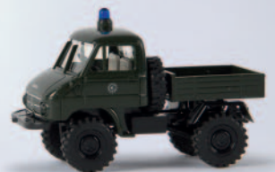
v 39024 Unimog 411 „Polizei“ 10,90 €