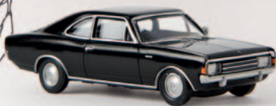
v 20657 Opel Rekord C Coupe, schwarz von Drummer 9,90 €