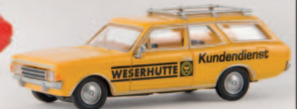
v 20557 Opel Rekord C CarAVan „Weserhütte“ von Drummer 10,90 €