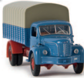
85301 Berliet GLR, brillantblau/rubinrot 17,90 €