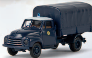
v 35319 Opel Blitz „Polizei Berlin“ 11,90 €