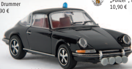
v 16258 Porsche 911 Targa „Begleitfahrzeug des Bundespräsidenten Heinemann“, TD 12,90 €

Bundespräsident Heinemanns Sicherheitstross wurde von einem dezenten schwarzen Targa angeführt. Da es dem obersten Mann im Staate aber zu langweilig war, immer nur einem Porsche hinterher zu fahren, folgte er 1971 einer Einladung von Porsche und nahm trotz größter Sicherheitsbedenken die Nürburgring-Nordschleife als Beifahrer von Willi Kauhsen im 917 unter die Räder. Die Bedenken waren unbegründet, er kam wohlbehalten am Ziel an. Lediglich der Opel-Blitz mit den Begleitpolizisten landete im Grünstreifen auf dem Dach, verletzt wurde aber zum Glück niemand.