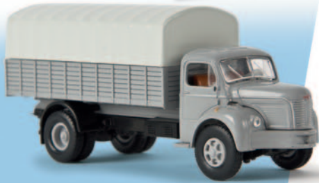
85300 Berliet GLR 8, signalgrau/schwarz 17,90 €