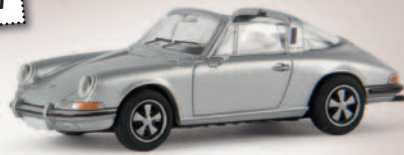
v 16259 Porsche 911 Targa F-Reihe, silber, TD 11,90 €