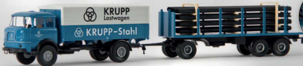
v 84121 Krupp LF 980 „Krupp Stahl“ mit Ladegut 23,90 €