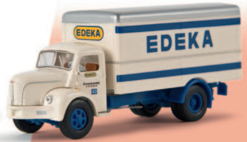
85303 Berliet GLR „Edeka Saarland“ 17,90 €