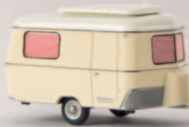
v 19314 Ford 12m mit Eriba Wohnwagen, TD 19,90 €