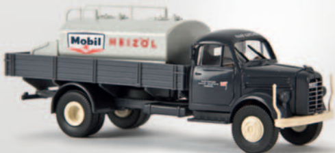
v 43022 Borgward B 4500 mit Heizöltank „Raab Karcher/Mobil“ 15,90 €