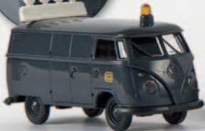
v 90409 Set „Schwerlast-Begleitung“ mit 3 Fahrzeugen und 3 Polizisten 31,90 €