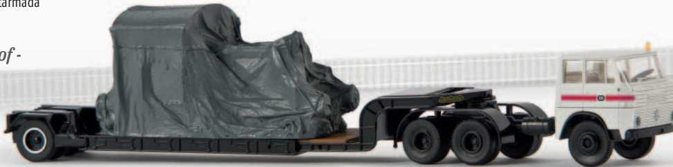
v 82204 Henschel HS 22 TS Tiefblende-SZ „DB“ mit „Köf unter Plane“ 34,90 €