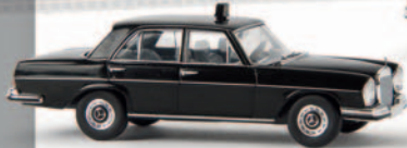
13108 MB 280 SE „Taxi“ von Starmada 14,90 €