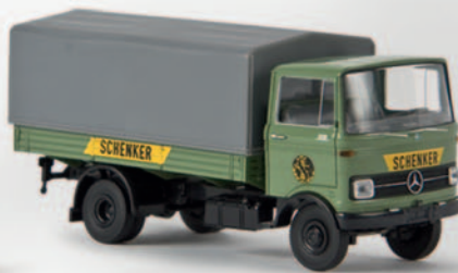
v 48511 MB LP 608 „Schenker“ 14,90 €