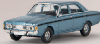
n 19461 Ford RS (P7b), eisblau-metallic, TD 12,90 €