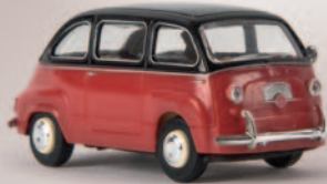
v 22453 Fiat Multipla, rot/schwarz, TD 10,90 €