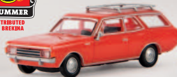
v 20553 Opel Rekord C CarAVan, rot von Drummer 9,90 €