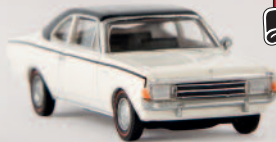
v 20655 Opel Rekord C Coupe, weiß/schwarz von Drummer 10,90 €