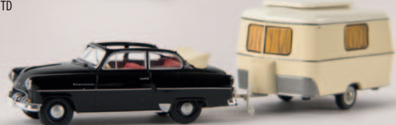
v 20225 Opel Olympia Cabrio mit Eriba Wohnwagen, TD 19,90 €