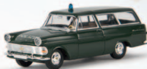
v 20171 Opel Rekord P11 CarAVan „Polizei“, TD 10,90 €