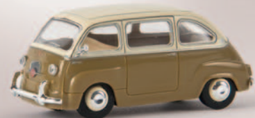
v 22455 Fiat Multipla, braun/hellfelfenbein, TD 10,90 €

Lange vor Erfindung des „GTI“ schuf Ford bereits die „RS“-Linie, unter der sportlich aufgewertete Versionen mit kräftigen Motoren angeboten wurden. Die beiden Modelle entsprechen Vorbildern aus 1969.