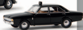
v 19407 Ford 17m (P7b) „Taxi“, TD 11,90 €