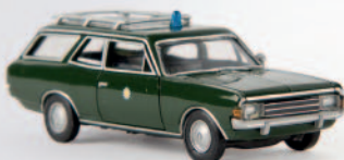
v 20559 Opel Rekord C CarAVan „Polizei“ von Drummer 10,90 €