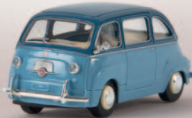
v 22454 Fiat Multipla, pastellblau/azurblau, TD 10,90 €