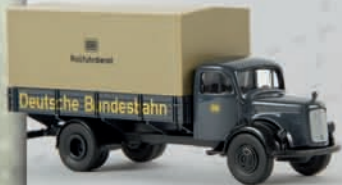
v 40016 MB L 311 „Rollfuhrdienst“