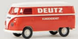
32581 VW Kasten T1b „Deutz Kundendienst“