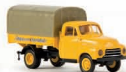
35313 Opel Blitz „Intercontinentale“