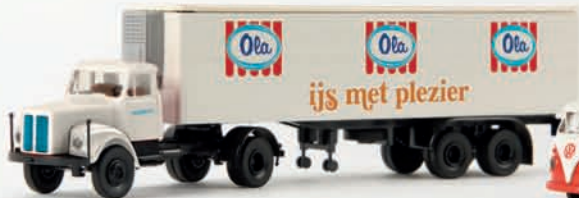
v 85121 Scania L 110 „Ola“