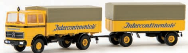
81030 MB LP 1418 „Intercontinentale“