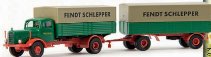
44306 MB L 325 „Fendt“