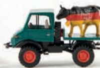
39082 Unimog 421 mit Kuh „Die faire Milch“