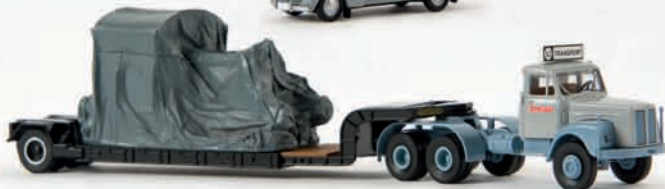
v 85120 Scania Schwertransporter „Svelast“, mit Ladegut