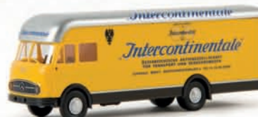
57214 MB LP 322 Möbelwagen „Intercontinentale“