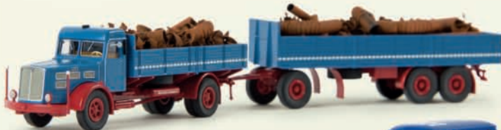
v 86205 Faun L 8 L mit Ladegut „Schrott“, TD