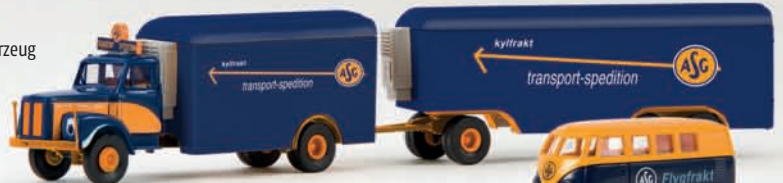
v 85008 Scania L 110 „ASG“