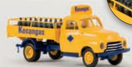
v 35320 Opel Blitz „Kosangas“ mit Ladegut