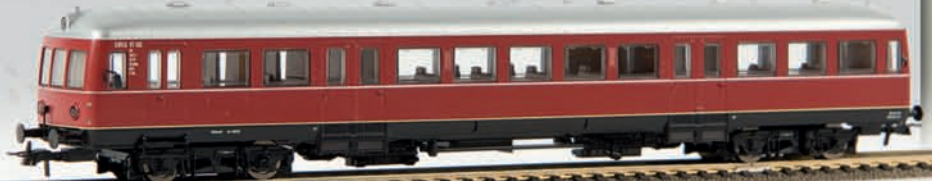
64100 Esslinger Triebwagen, VT 102 „SWEG“ (DC), TD

Demnächst in der Auslieferung: Der von 1951 - 1955 gebaute vierachsige Privatbahn-Triebwagen in der Version der SWEG (Südwestdeutsche Eisenbahn-Gesellschaft mbH). Beide Ausführungen (mit - und ohne Werbung) sind in Kürze lieferbar.