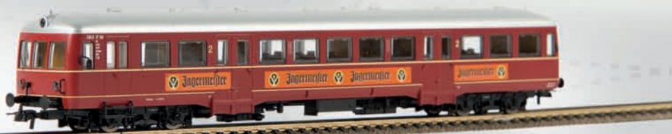
64101 Esslinger Triebwagen, VT 104 „SWEG/Jägermeister“ (DC), TD