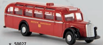
v 50027 MB 0 6600 Reisebus „DB“